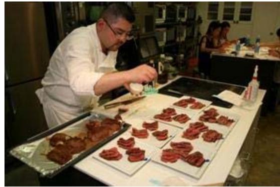
タリアータ(薄切肉料理)の食べ比べ

今後は、県内産地探訪ツアー等を企画しており、産地と実需のマッチングをより強固なものにしていく予定です。(普及現地情報より)